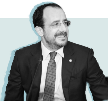
Präsident Nikos Christodoulides

Die Republik Zypern ist eine präsidentielle Demokratie mit einem Einkammersystem: Das Repräsentantenhaus umfasst offiziell 80 Sitze, von denen 56 für griechische und 24 für türkische Zyper:innen vorgesehen sind; letztere bleiben jedoch aufgrund der Teilung des Landes unbesetzt. Die Sperrklausel liegt bei 3,6 Prozent. Zusätzlich können die religiösen Minderheiten der Armenier, maronitischen und lateinischen Katholiken jeweils eine:n Vertreter:in wählen, welche im Repräsentantenhaus Stellung nehmen, aber nicht abstimmen dürfen. Der:die Präsident:in ist zugleich Staats- und Regierungschef:in, ernennt die Minister:innen und wird in einer direkten Wahl für fünf Jahre gewählt. Weder Präsident:in noch Minister:innen dürfen dem Parlament angehören.