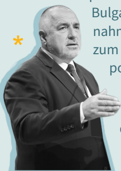
Bojko Borissow (GERB)

Relevant ist Bulgarien auch für die Beitrittsverhandlungen mit Nordmazedonien, die es wegen Differenzen zum gemeinsamen Nachbarschaftsvertrag wiederholt blockiert hat.