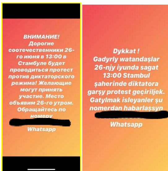
Рис. 1. Призыв присоединиться к протесту на русском и туркменском языках, который был распространен в Instagram.

Широко распространяемые материалы протестов послужили еще одной важной цели – определить программу дальнейших действий и выявить нарративы, отражающие наибольшую заинтересованность местных туркменских диаспор. Хотя протесты на Северном Кипре, в Турции и США имели общие нарративы, такие как освещение всепроникающей коррупции и призывы к отставке президента и правительства, анализ помог выявить различия в их повестке дня. Протесты в США были сосредоточены в основном вокруг политических вопросов и нарушений прав человека, включая в отношении трудовых иммигрантов в Турции и на Северном Кипре. Они также были нацелены не только на туркменское правительство, но и на политиков США и международные организации, такие как ООН и ВОЗ, чтобы призвать их привлечь внимание к нежеланию руководства страны всецело выполнять свои международные обязательства. Места проведения протестов отражают эти цели, поскольку демонстрации проходили перед посольством Туркменистана, офисами ООН и ВОЗ, а также Конгрессом США. В этом ключе активисты использовали плакаты и слоганы преимущественно на английском языке, чтобы донести свои сообщения до выявленной аудитории (рис. 2).