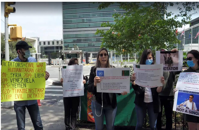
Рис. 2. Примеры плакатов во время одной из акций протеста в Нью-Йорке, США.

Протесты на Северном Кипре и в Турции, с другой стороны, в основном были сосредоточены вокруг вопросов, которые непосредственно касались туркменских трудовых иммигрантов, которые были главной силой протестов в этих странах. Протестующие, например, обозначили основные социально-экономические факторы, заставившие их покинуть страну в поисках лучшей жизни за границей, и выразили недовольство работой туркменского посольства, которое не продлевало паспорта, не организовывало обратные рейсы в Туркменистан и не оказывало помощь местной диаспоре с проблемами, вызванными пандемией COVID-19, такими как потеря работы и дохода. В случае с иммигрантами на Северном Кипре вопрос о позиции правительства, которое препятствовало возвращению людей в эту страну на работу и вынуждало их платить огромные взятки миграционным сотрудникам, было одной из главных тем всех протестных действий.