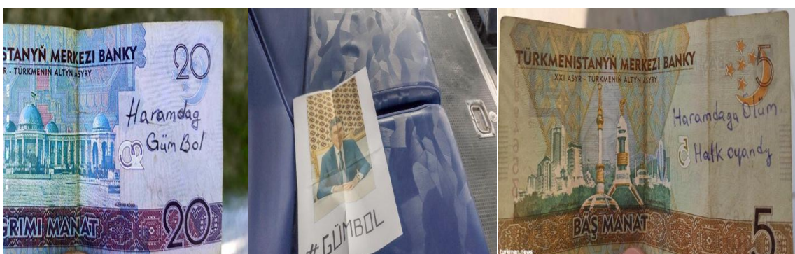
Рис. 3. Примеры антиправительственных высказываний на банкнотах как формы выражения протеста внутри Туркменистана.

Эти символы сопротивления активисты попытались распространить и на Туркменистан; например, одна из групп объявила, что в сентябре 2020 г. проведет уличные акции протеста «белорубашечников»; однако из-за плохой организации оно вылилось лишь в единичные и изолированные акции. В то же время, упомянутый лозунг появился на многих банкнотах и антиправительственных листовках внутри страны как одна из молчаливых форм протеста (рис. 3). Несколько YouTube-каналов также поделились видео-«заявлениями» простых людей как внутри страны, так и за ее пределами, которые выразили недовольство властью и заявили, что присоединились к протестному движению.